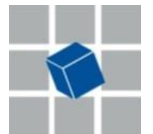
Abb. 1: Komplexität als Schlüsselkategorie